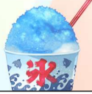
かき氷/ブルーハワイ ¥350