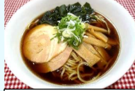
富山ブラックラーメン ¥900