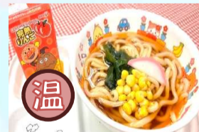
お子様うどん (温) ¥700