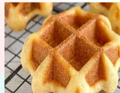
ベルギーワッフル1個 ¥150