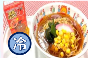
冷やしお子様ラーメン ¥750