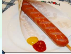
あらびきフランク ¥300