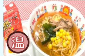
お子様ラーメン (温) ¥700