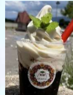
コーヒゼリーソフト ¥650