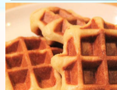
ベルギーワッフル5個 ¥600